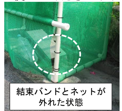
結束バンドとネットが外れた状態

現在使用しているごみ収集箱の緑色のネットはカラス対策のために硬めの材質を使用しています。ごみ袋を詰め込みすぎると右図のように隙間が空いてしまいます。2つ収集箱を設置している所は、分けてごみを出してください。詰め込みすぎないでください。