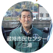
蔵持市民センター 三瀬