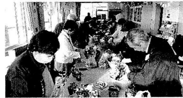
葉牡丹の寄せ植え講習会の様子

※「味噌づくり教室」は参加希望者多数のため抽選となります。1月15日前後に申込者全員に連絡予定です。