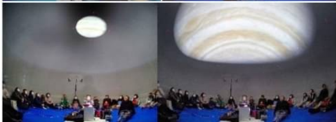
ドームの中は意外と広々。迫りくる木星にみんなびっくり！