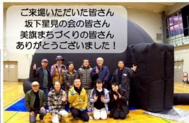
たくさんの方のご協力をいただき無事に終了☆