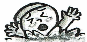
県内の水難事故発生状況 (令和5年)