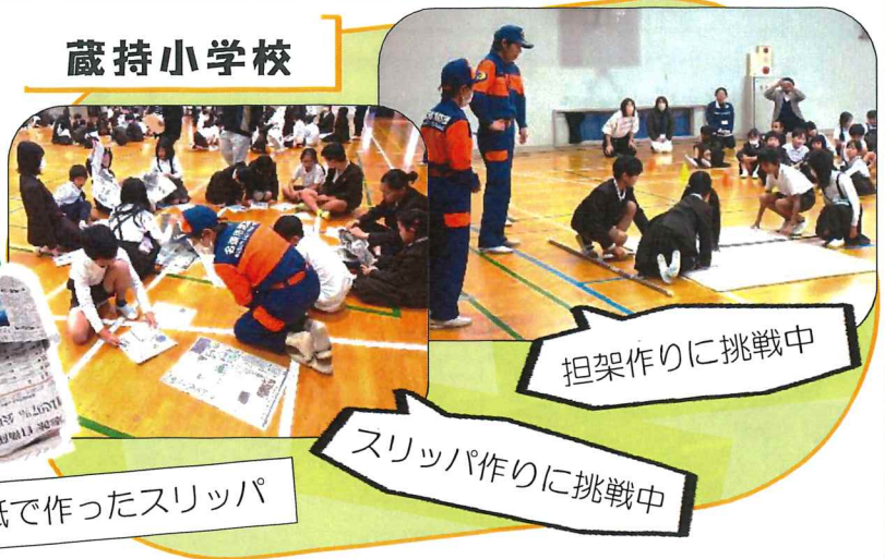
スリッパ作りに挑戦中