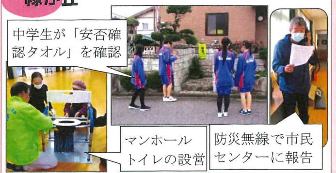
マンホールトイレの設営