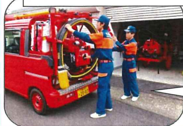
消防団がポンプ車の点検