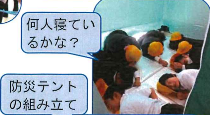
防災テントの組み立て