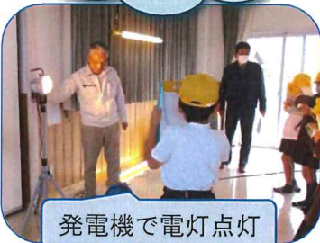
発電機で電灯点灯