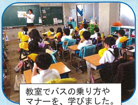
教室でバスの乗り方やマナーを、学びました。

10月18日(金)、蔵持小学校の2年生が参加して、「バスの乗り方教室」が開催されました。