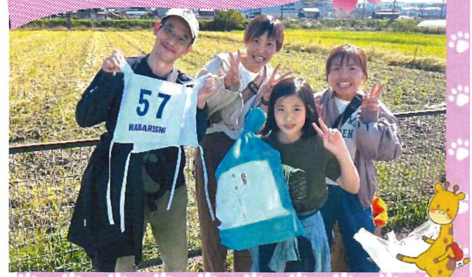
さくらコース 優勝チーム 「はらっち」