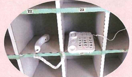
蔵小 特設公衆電話の開設

この経験を生かしてこれからも、いつ発生するか分からない災害に備えていきましょう。